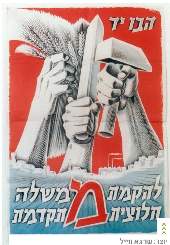
יוצר: שרגא ווייל

מקור: ארכיון השומר הצעיר 'יד יערי', גבעת חביבה.