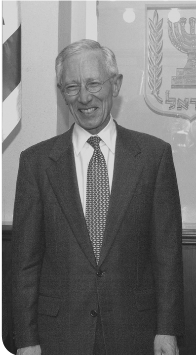
אתה לא תגיד נגיד!! | עמ' 12

כתב עת סוציאליסטי לעניני חברה, כלכלה, פוליטיקה ותרבות